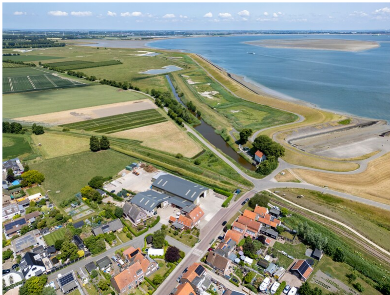
Een polder bij

Hoedekenskerke zou kunnen dienen als proefgebied voor de wisselpolder.